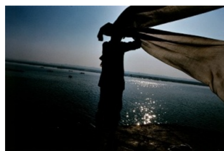
藤原新也《全東洋写真シリーズ》1969年、 東京都写真美術館蔵