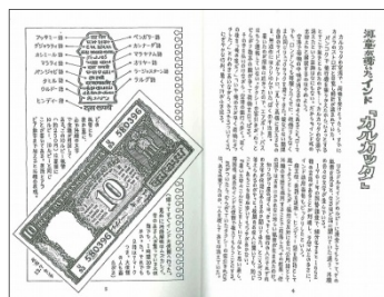
妹尾河童《『河童が覗いたインド』原画》1985年、個人蔵