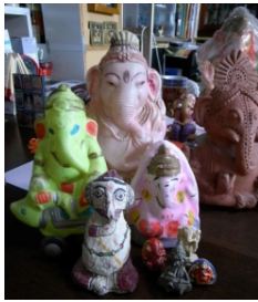
【小磯コレクション】 ガネーシャ神の置物