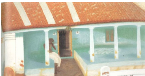
秋野不矩《ブルーミンの家》1984年、 静岡県立美術館蔵