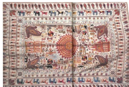
【岩立広子コレクション】染織コレクション