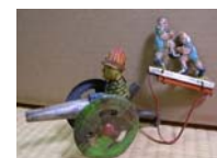
【畠中コレクション】（彫刻・ブリキ玩具）