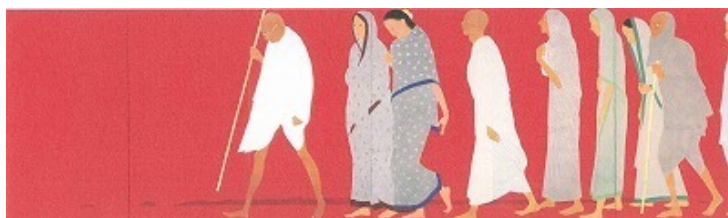
畠中光享《塩の行進》2007年、個人蔵（部分）