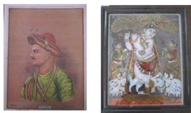
【黒田豊コレクション】