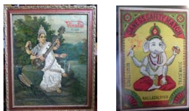
【中嶋コレクション】