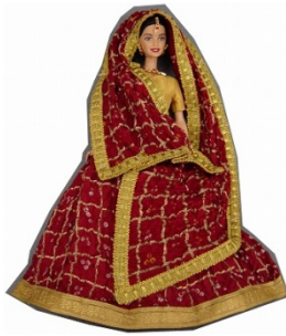
【杉本良男コレクション】 インドのバービー人形