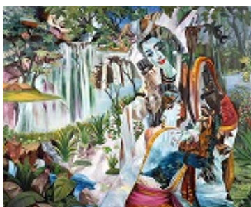
横尾忠則《悠久の愛》1991年、個人蔵